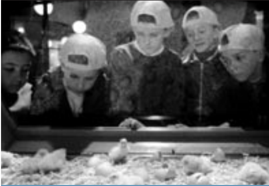
La incubadora, a l'altura de la mirada del públic més jove, permet veure els ous fins al naixement dels pollets.