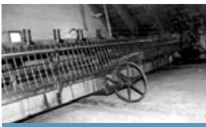
La Mule Jenny (s. XIX), una de les màquines més emblemàtiques de la Fàbrica dera Lan.

Web: www.aran.org . Adreça electrònica: museu@aran.org .