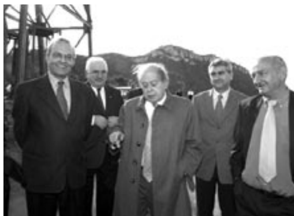
Jordi Pujol acompanyat per E. Casanelles i J. Torné, a la inauguració del Museu de les mines de Bellmunt.

Aquest hivern, el Sistema del mNACTEC ha vist com dos dels projectes engegats des de feia temps s'estrenaven oficialment. D'una banda, el dia 5 de desembre de 2002 Jordi Pujol inaugurarà el Museu de les Mines de Bellmunt del Priorat. El condicionament de la mina —per fer-la visitable— i dels edificis industrials annexos, ha possibilitat la recuperació del conjunt, la revalorització com a equipament d'alt interès patrimonial i turístic, i el convertir-se en el centre d'interpretació de la mineria del plom a la comarca. D'altra banda, el passat 19 de gener es va inaugurar la rehabilitació de l'Ecomuseu-Farinera de Castelló d'Empúries, en un acte presi-