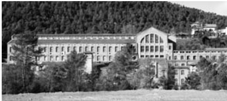
Façana posterior de la fàbrica.

Coordinadora del Museu de la Colònia Vidal de Puig-reig