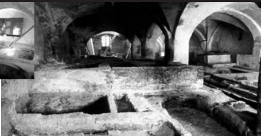
L'antiga adoberia de Cal Granotes (Museu de la Pell d'Igualada i Comarcal de l'Anoia) és un edifici industrial del s. XVIII museïtzat des de 1990.