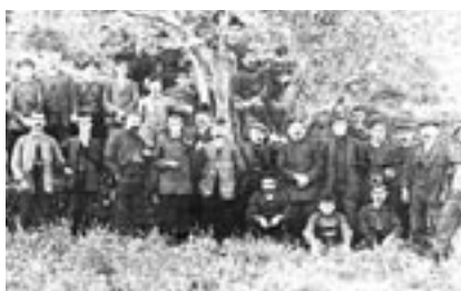
Cors Clavé (1915-18). La colònia comptà amb una gran activitat social entorn a la cultura i el lleure.

En la decisió de trobar noves sortides a l'antiga Colònia Vidal hi influí el fet del desenvolupament que el turisme industrial ha anat adquirint en certs països d'Europa —Gran Bretanya, França i Alemanya— i sobretot el cas de New Lanark, una antiga colònia tèxtil escocesa de gran rellevància històrica que ofereix, a més d'un museu sobre el tèxtil i la vida a la colònia, un hotel, un apart-hotel, un alberg de joventut, restaurants, bars i botigues. A la Colònia Vidal el projecte que finalment s'ha consolidat ha estat el del museu.