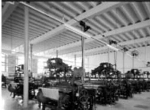
Durant la visita es mostra una nau amb telers actuals en funcionament.

En la decisió de trobar noves sortides a l'antiga Colònia Vidal hi influí el fet del desenvolupament que el turisme industrial ha anat adquirint en certs països d'Europa —Gran Bretanya, França i Alemanya— i sobretot el cas de New Lanark, una antiga colònia tèxtil escocesa de gran rellevància històrica que ofereix, a més d'un museu sobre el tèxtil i la vida a la colònia, un hotel, un apart-hotel, un alberg de joventut, restaurants, bars i botigues. A la Colònia Vidal el projecte que finalment s'ha consolidat ha estat el del museu.